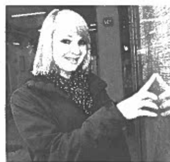
Die Bahn ist ein gefragtes Nahverkehrsmittel.