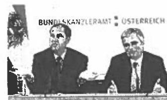
Zurück aus dem Urlaub: Faymann (r.) und Pröll.