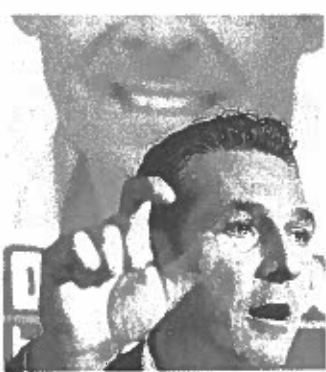
FPÖ-Chef Strache ist Spitzenkandidat in Wien.

von Wien werden WIEN. FPÖ-Bundesobmann Heinz-Christian Strache präsentierte gestern die Kandidatenliste seiner Partei für die Wien-Wahl am 10. Oktober. Er selbst wird auf dem ersten Listenplatz als „Bürgermeister-Kandidat“ ins Rennen gehen. Sein Wahlziel lautet freilich „mindestens 20 Prozent“; die Wahrscheinlichkeit, dass er damit Stadt- oberhaupt wird, ist gering. VN