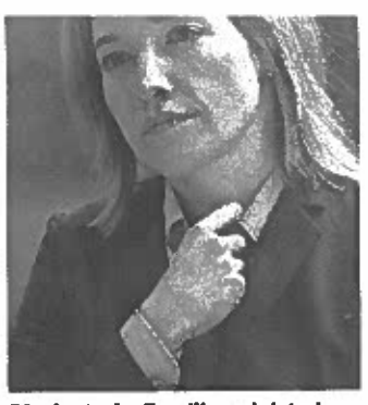
Die deutsche Familienministerin Kristina Schröder.