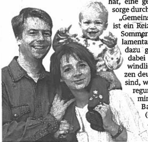
Justizministerin will, dass beide Eltern auch nach einer Scheidung fürs Kind zuständig bleiben.

Ewig will die zuständige Justizministerin die Streitfragen indes nicht offen lassen. Die Arbeitsgruppe soll am 20. September erstmals tagen und dann zügig ans Werk gehen. Noch heuer sollen laut Hefelle konkrete Vorschläge vorliegen. VN-JOH